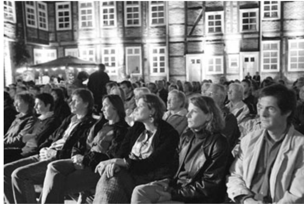
Rund 350 Zuhörer erlebten zu später Stunde im Dom-Innenhof ein Konzert fürs Auge und fürs Ohr und genossen die tolle Atmosphäre.